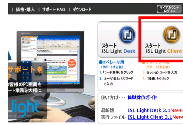
赤枠内のボタンをクリックすると ISL Lightが起動する。