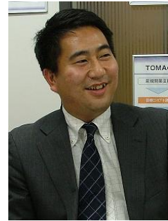
「会計ソフトの電話サポートはなかなかうまくいきません」