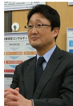
「今後もTOMAの顧客先満足度向上をご支援下さい。」

TOMAコンサルタンツグループ株式会社様、 本日はお忙しい中、貴重なお話をありがとうございました。